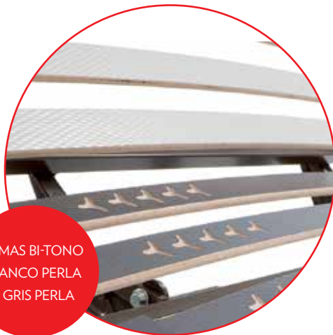
LAMAS BI-TONO BLANCO PERLA Y GRIS PERLA